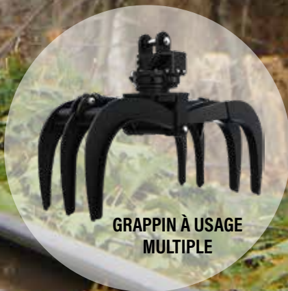
GRAPPIN À USAGE MULTIPLE