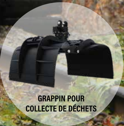
GRAPPIN POUR COLLECTE DE DÉCHETS