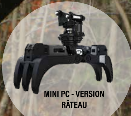
MINI PC - VERSION RÂTEAU