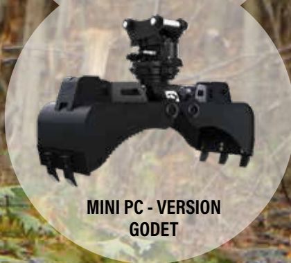
MINI PC - VERSION GODET