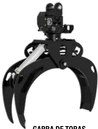
GARRA DE TORAS