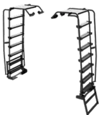
ESCALA DE LUXO