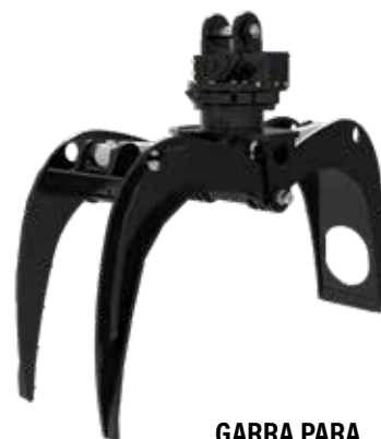
GARRA PARA DORMENTES