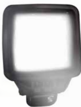
LUZES DE LED