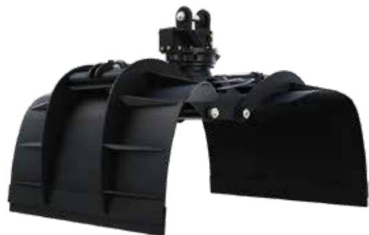
GARRA PARA RESÍDUOS