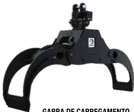
GARRA DE CARREGAMENTO