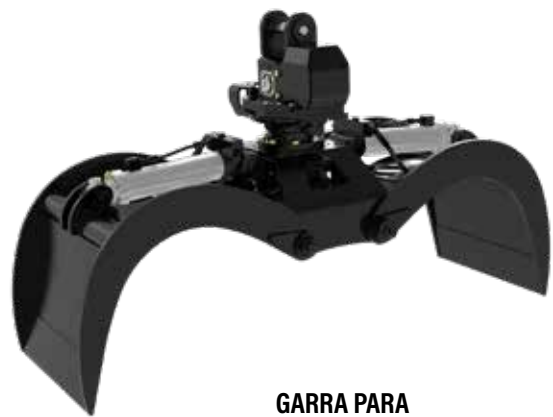
GARRA PARA PÁTIO DE MADEIRAS