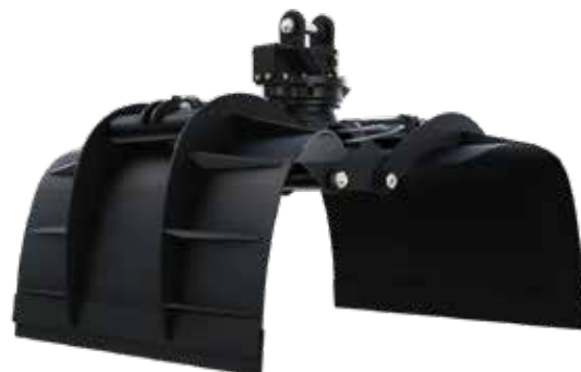
GARRA PARA RESÍDUOS