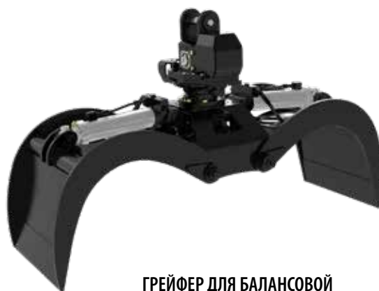
ГРЕЙФЕР ДЛЯ БАЛАНСОВОЙ ДРЕВЕСИНЫ