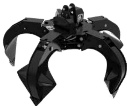
ГРЕЙФЕР POLY GRAB